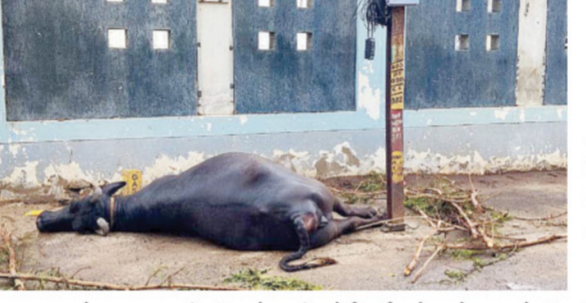
ભુજના ભાવેશ્વરનગરમાં વીજપોલમાં શોર્ટસર્કિટનો ભોગ બનેલી ભેંસ તસવીરમાં નજરે પડે છે.